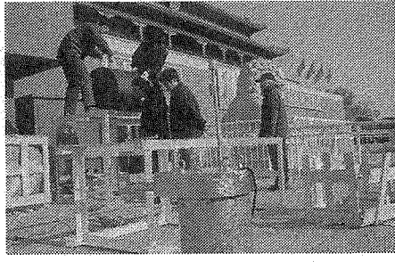
天安門前にある池にマイク ロボブル発生装置を設置